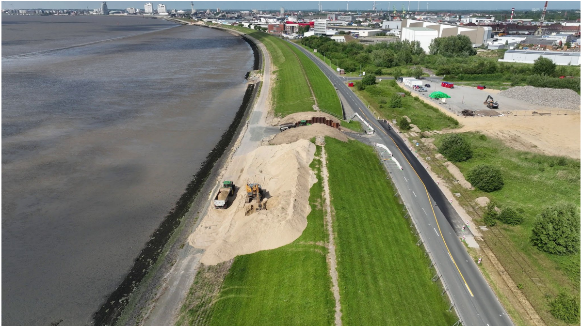
Deichertüchtigung Seedeich im Sommer 2023