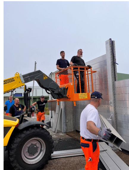
Dammbalkenverschluss auf der Columbusinsel

Wie nahezu in jedem Jahr mussten 2023 wieder Schäden an den Deichen ausgebessert werden. Der Umfang hielt sich jedoch sehr in Grenzen. Am auffälligsten für Außenstehende war die Reparatur der Deichtreppe am SailCity-Gebäude. Aufgrund von leichten Sackungen des Deiches bekamen die Treppenstufen in den vergangenen Jahren eine Schiefstellung, die im Jahr 2023 durch den Einbau einer weiteren Treppenstufe behoben wurde. Weiterhin wurden am Weserdeich kleinere Schäden, die von der Sturmflut Ende 2023 verursacht wurden, ausgebessert.