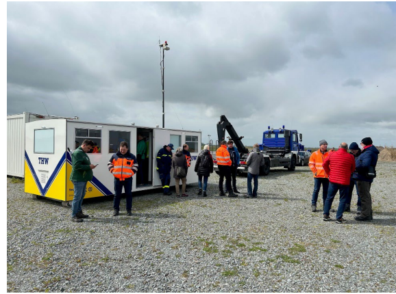
Mobiles Einsatzzentrum des THW

Im Herbst 2023 fand über drei Tage wieder die sogenannte Deichverschlusschau mit der oberen Wasserbehörde statt. Im Ergebnis befinden sich alle Anlagen in einem guten Zustand.