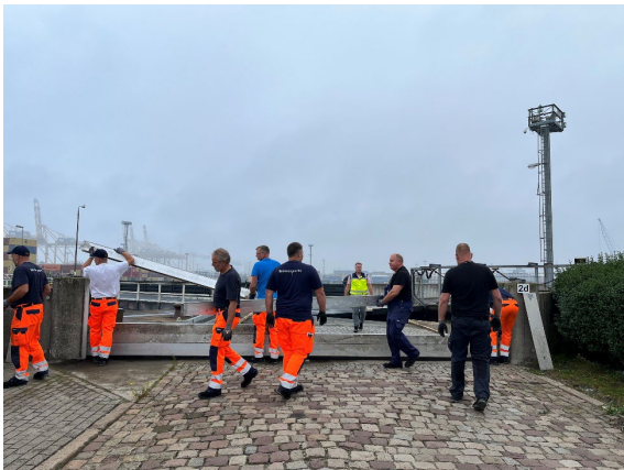
Setzen der Dammbalken am Deichschart Nordschleuse im Herbst 2023

Im Herbst 2023 fand über drei Tage wieder die sogenannte Deichverschlusschau mit der oberen Wasserbehörde statt. Im Ergebnis befinden sich alle Anlagen in einem guten Zustand.