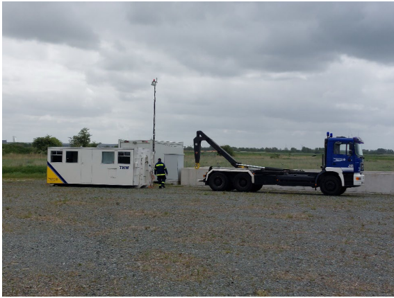
Mobiles Einsatzzentrum des THW

Im Rahmen der Frühjahrsdeichschau wurde den Teilnehmenden auch das mobile Einsatzlagezentrum des THW vorgestellt, das im Katastrophenfall schnell den Betrieb aufnehmen kann.