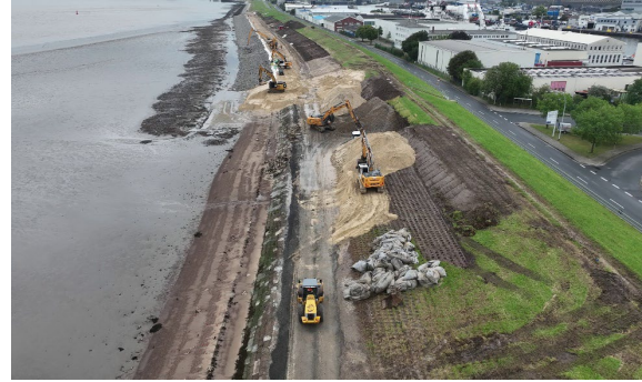
Baustelle mittlerer Seedeich

Auch die Planungen zum Neubau des Sperrwerks in der Geestemündung wurden 2023 weiter vorangetrieben, so dass Ende 2023 der Bauentwurf an die zuständigen Behörden zur Abstimmung übergeben werden konnte. Anfang 2024 haben Informationstermine mit Anliegern und Behördenvertretern stattgefunden. Im Frühjahr 2024 ist ein weiterer Informationstermin für alle interessierten Bürgerinnen und Bürger vorgesehen.