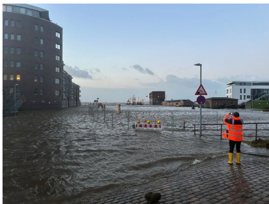
Hochwasser „Am Alten Vorhafen“ am 22.12.2023

Infolge der Sturmflut kam es auch wieder zur Ablagerung von erheblichen Treibselmengen auf den Deichen. Insgesamt wurden rd. 10.000 m 3 Treibsel angeschwemmt, die überwiegend Anfang 2024 abgeräumt und auf den Treibselagerplatz zur weiteren Behandlung verbracht wurden.