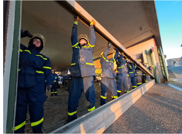
gemeinsame Hochwasserschutzübung mit dem THW