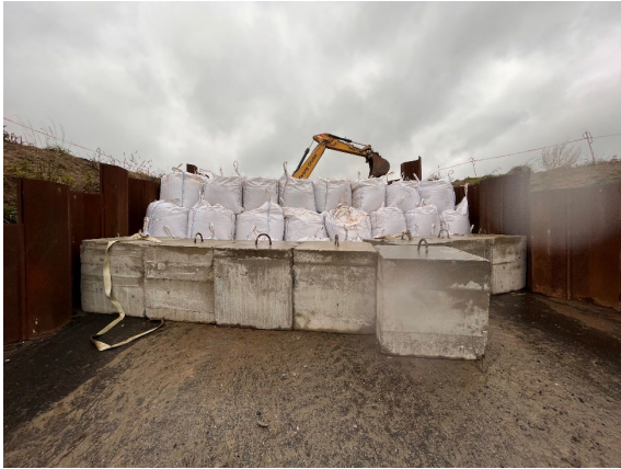
Wintersicherung Deichschart Seedeich