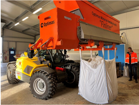
Neues BigBag-Befüllgerät der bremenports