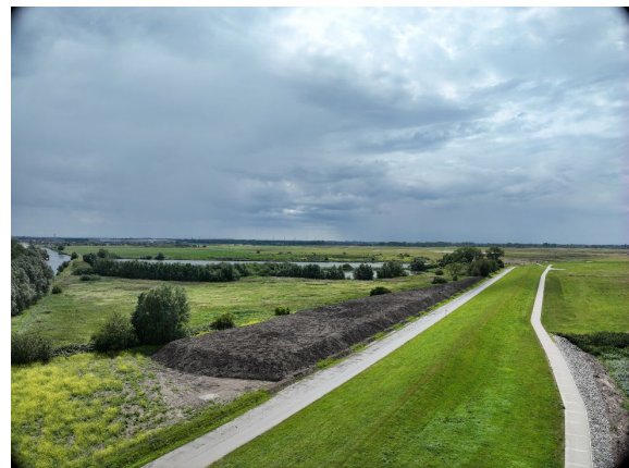
temporäres Kleilager Luneplate

Für den schnellen Einsatz im Fall von Hochwasserereignissen hat bremenports in 2023 eine Maschine zum schnellen Befüllen von sogenannten BigBags beschafft. Dieses Gerät ist auch mit dem Teelader des THW kompatibel, so dass im Hochwasserfall eine Redundanz gegeben ist. Zusätzlich fanden im Rahmen der Kooperationsvereinbarung mit dem THW in 2023 zwei gemeinsame Hochwasserschutzübungen statt. Diese Übungen sind ein wichtiger Baustein zur Verbesserung des Hochwasserschutzes in Bremerhaven. Darüber hinaus wird das große ehrenamtliche Engagement des THW im Sinne der Hochwassersicherheit Bremerhavens gefördert.