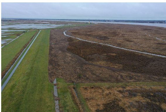
Treibselablagerung Luneplate im Dezember 2023

Infolge der Sturmflut kam es auch wieder zur Ablagerung von erheblichen Treibselmengen auf den Deichen. Insgesamt wurden rd. 10.000 m 3 Treibsel angeschwemmt, die überwiegend Anfang 2024 abgeräumt und auf den Treibselagerplatz zur weiteren Behandlung verbracht wurden.