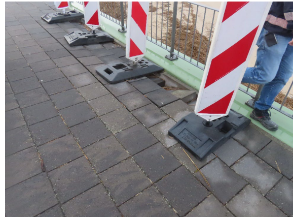
Versackungen am Weserdeich als Folge der Dezember-Sturmflut