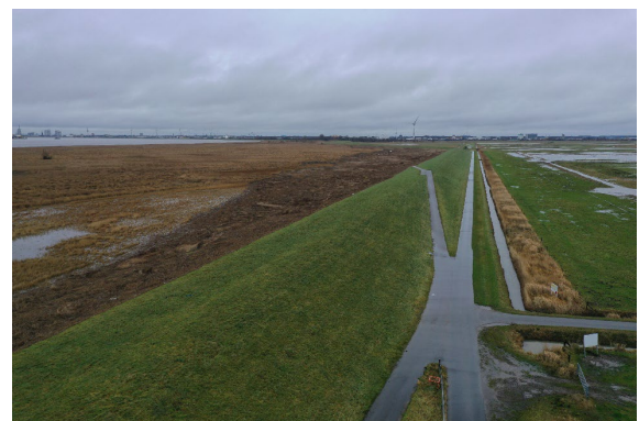
Treibselablagerung Luneplate im Dezember 2023