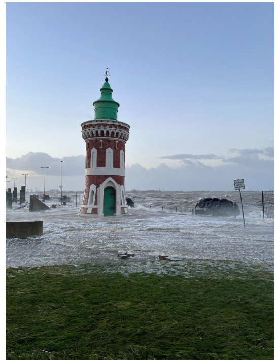
Hochwasser am Pingelturm am 22.12.2023