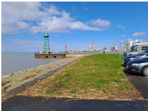
Testfeld für den Einbau von Geogittern an der Südmole